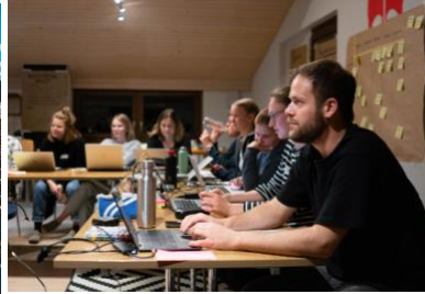
Möglich dank 64'780 Stunden ehrenamtlicher Arbeit von jungen Erwachsenen.