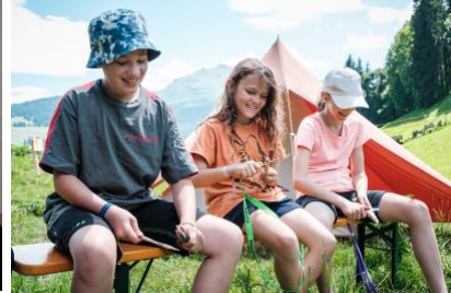
Spielerisch lernen und Erfahrungen fürs Leben sammeln.

Das Jublasurium von Jungwacht Blauring (kurz «Jubla») ist ein einmaliges Erlebnis: Über 10'000 Kinder und Jugendliche aus der ganzen Deutschschweiz kommen über Pfingsten zum grössten diesjährigen Zeltlager der Schweiz in Wettingen (AG) zusammen.