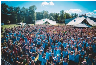
10'000 Kinder und Jugendliche erleben das erste nationale Pfingstlager von Jungwacht Blauring.