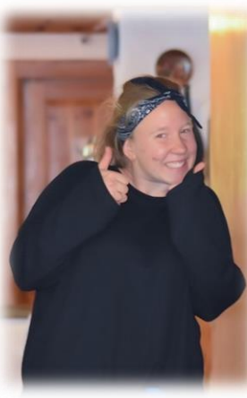
Rebi Finanzen & PR