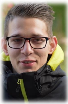
Stifu J&S Leiter