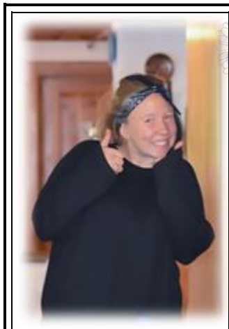
REBI FINANZEN & PR