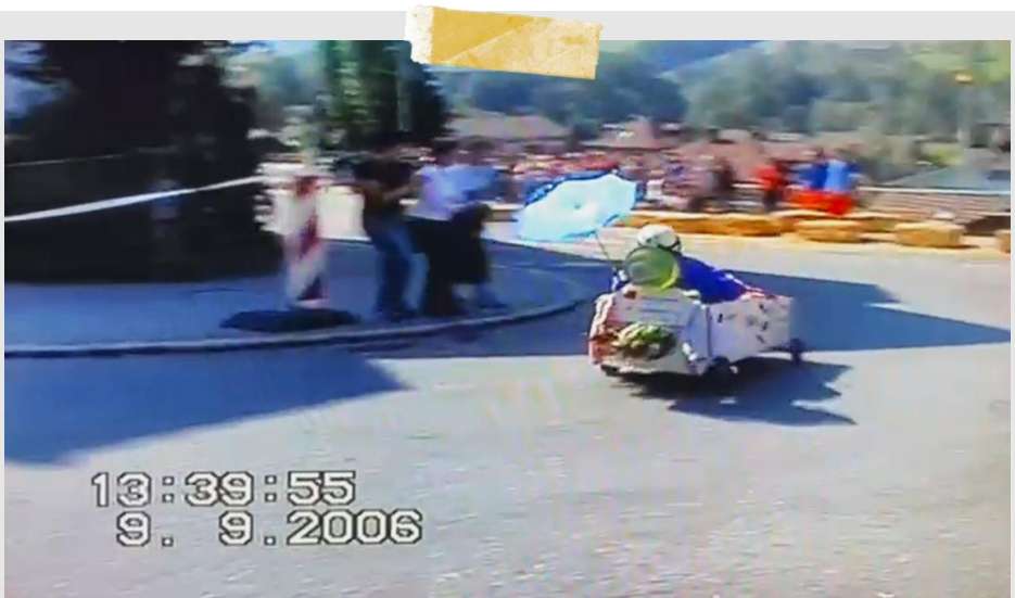
Screenshot aus einem Video vom letzten Seifenkistenrennen [Text: Damian Arnet]

Hast du noch Fragen: melde dich beim OK!